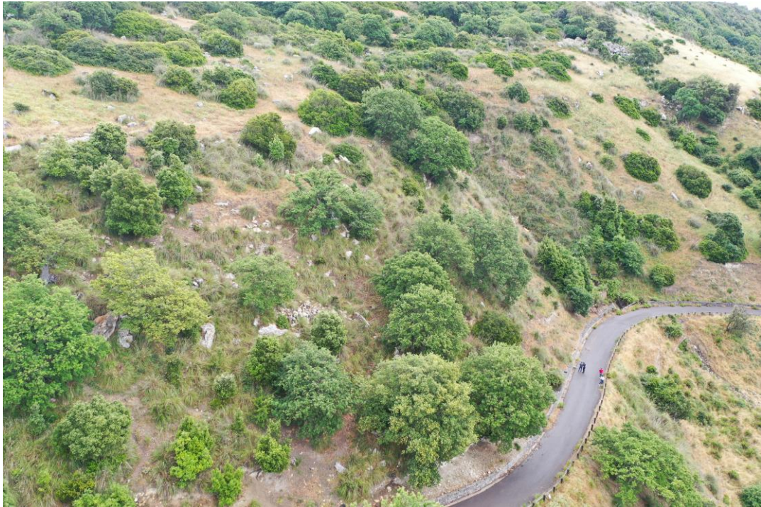
Vista generale zona di intervento