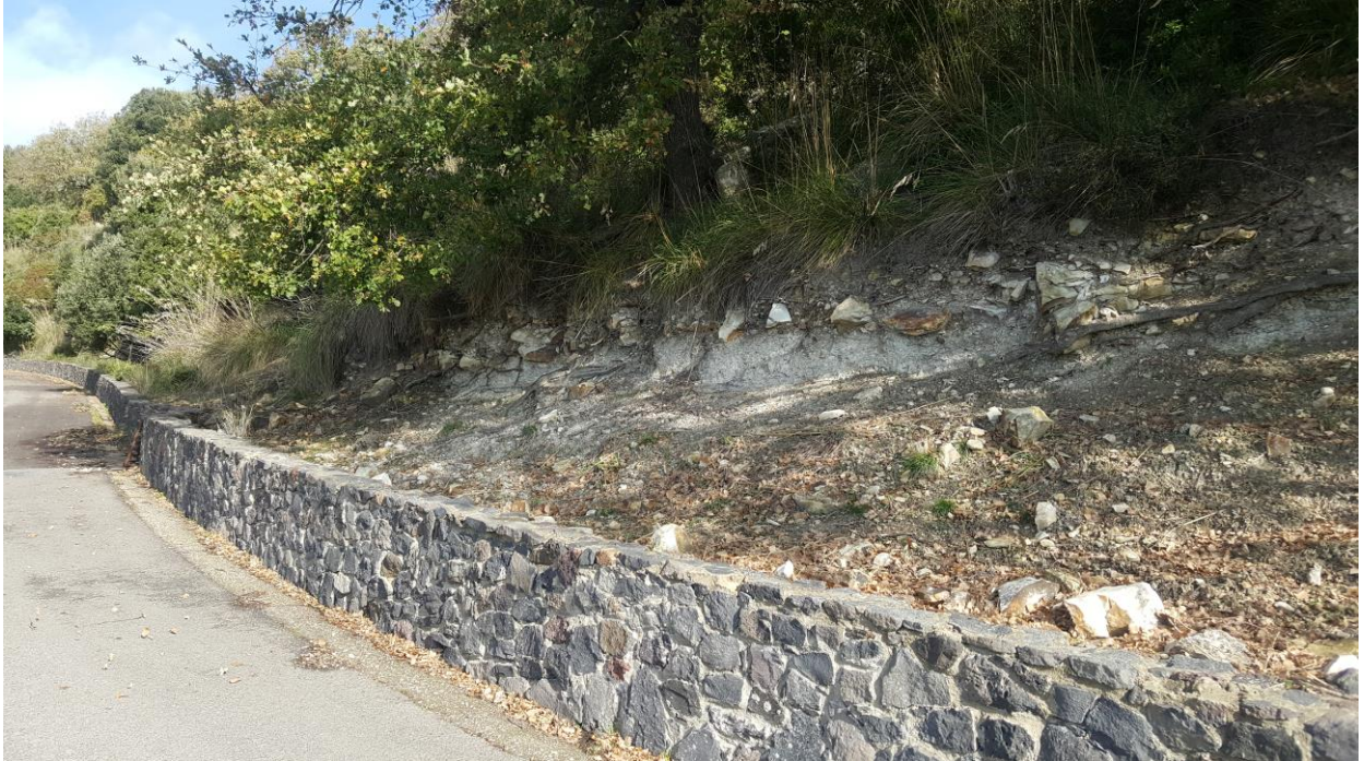
Vista limite inferiore costone