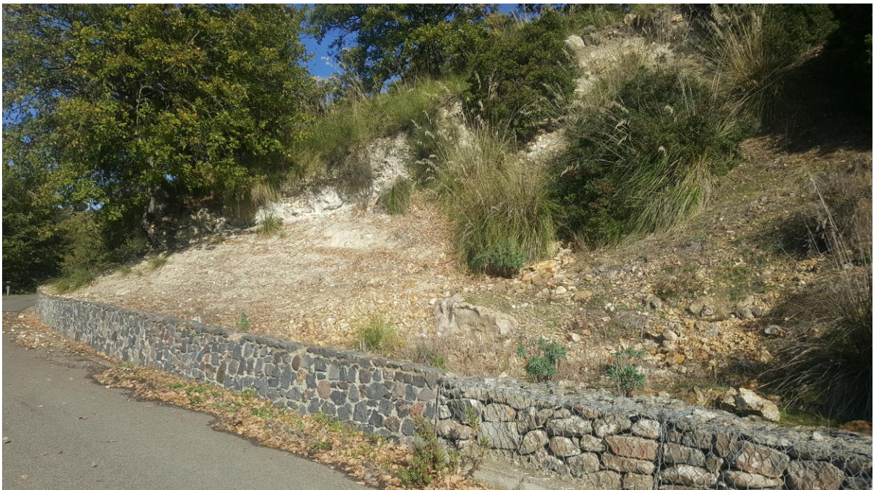
Vista limite inferiore costone