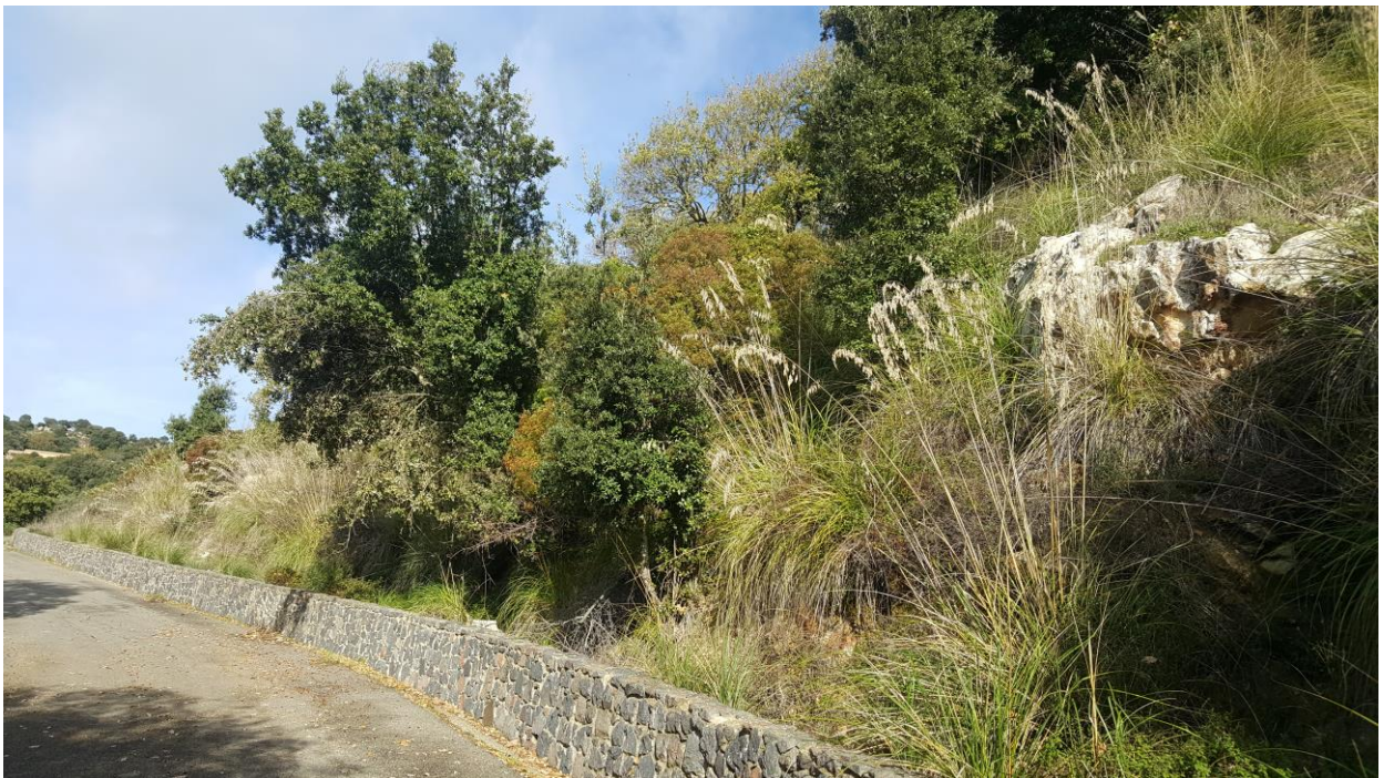
Vista limite inferiore costone