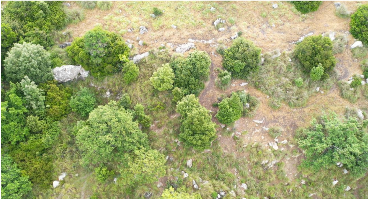
Vista limite superiore dettagliata costone