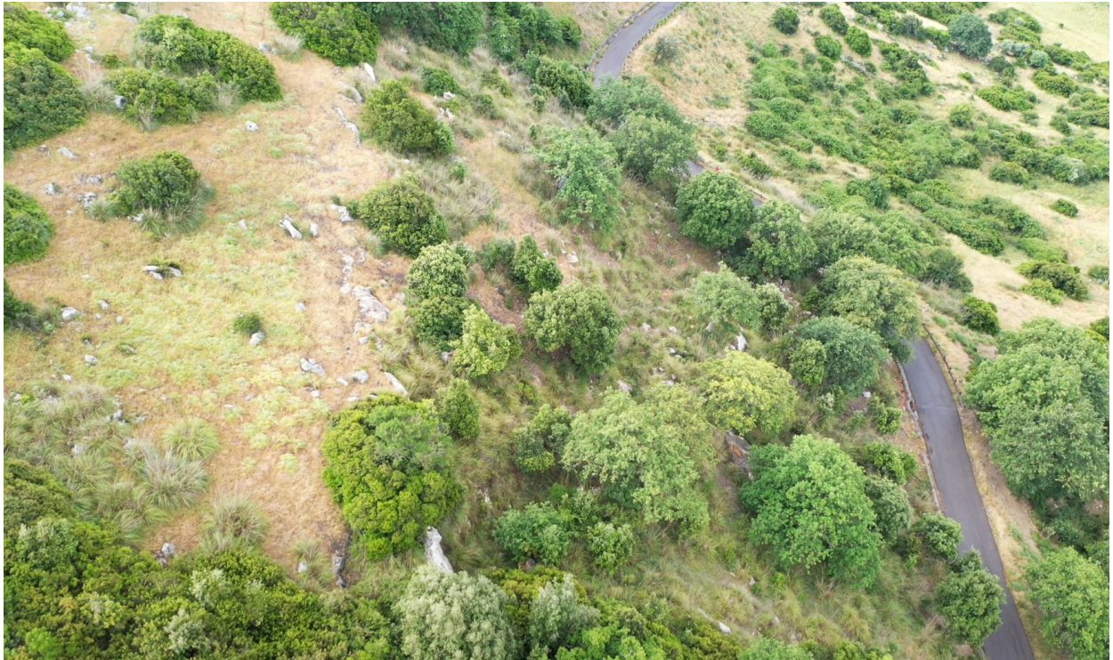
Vista limite superiore costone