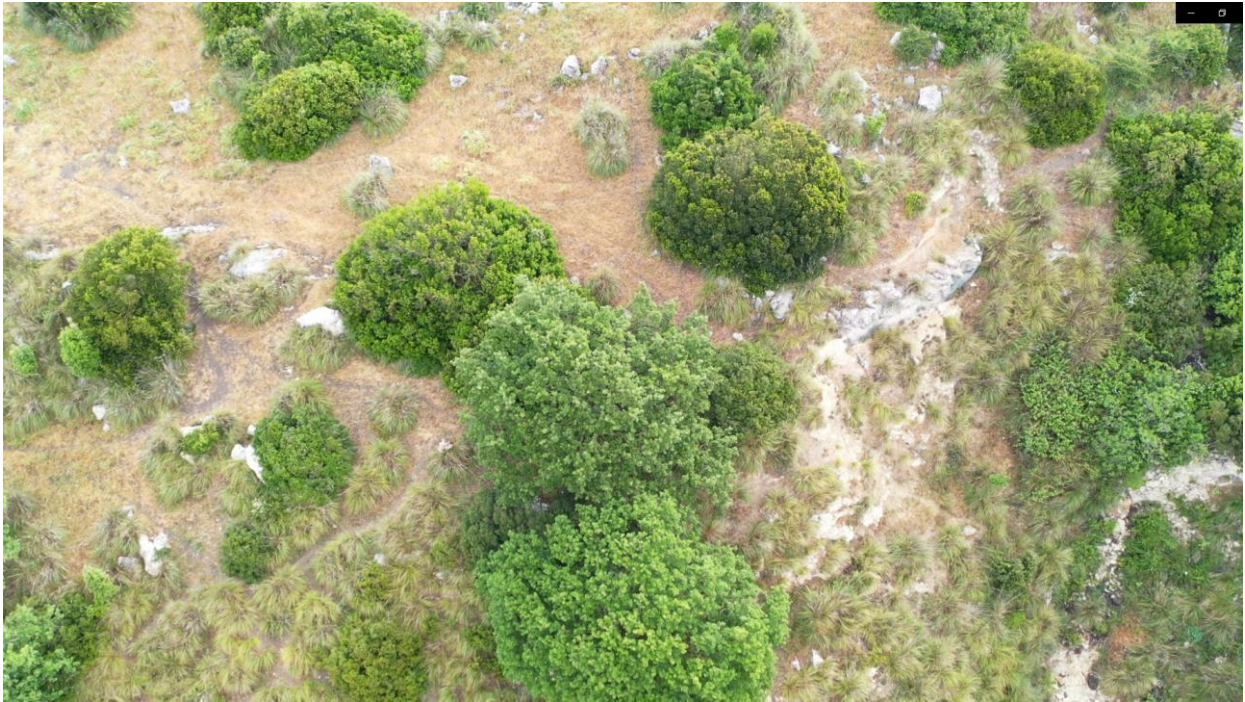
Vista limite superiore dettagliata costone