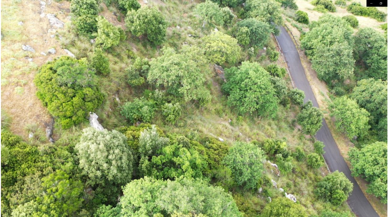
Vista limite superiore costone