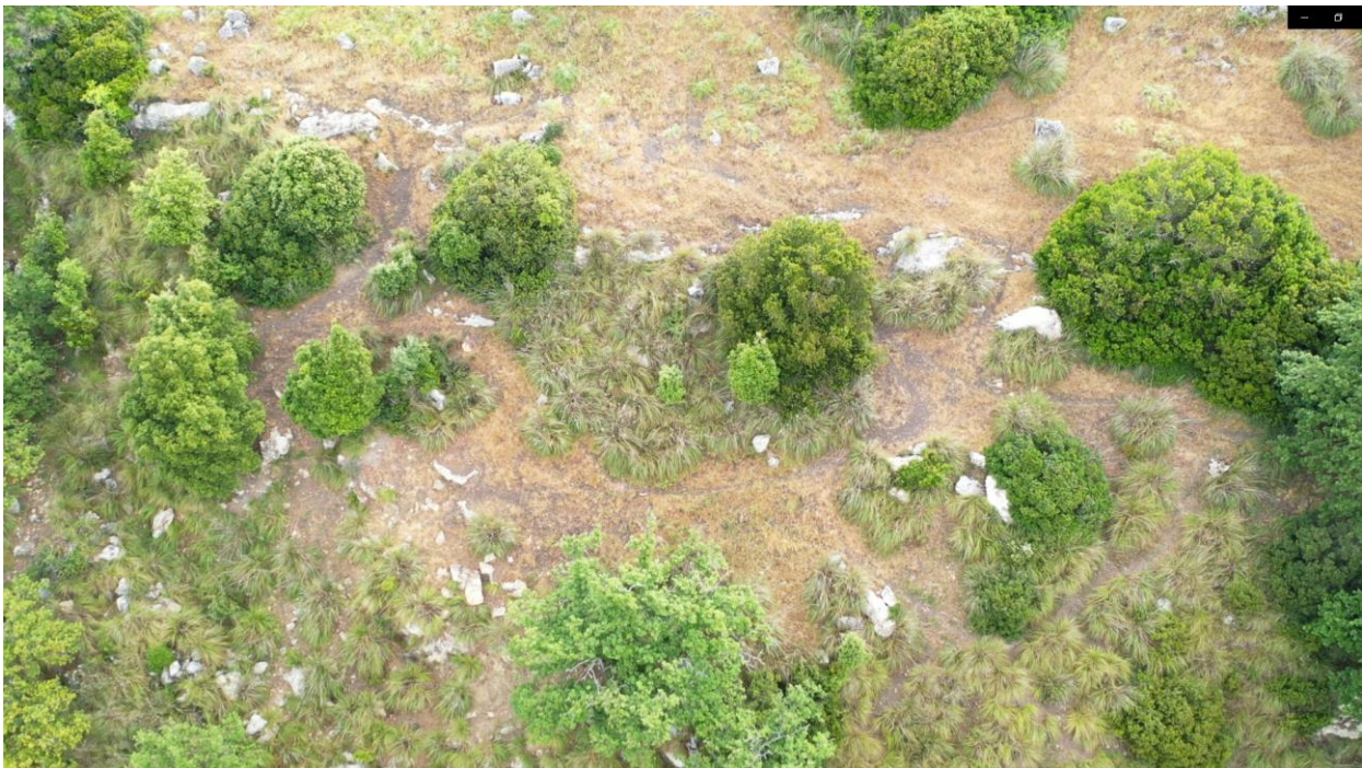
Vista limite superiore dettagliata costone