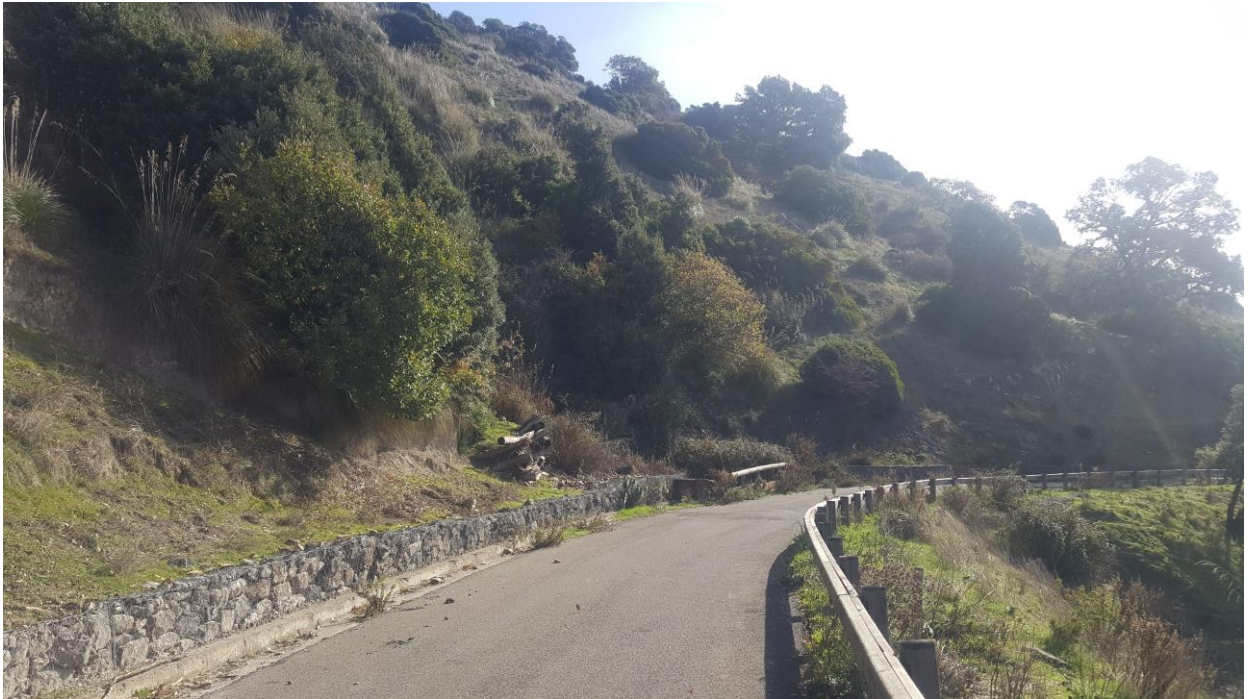
Vista limite inferiore costone