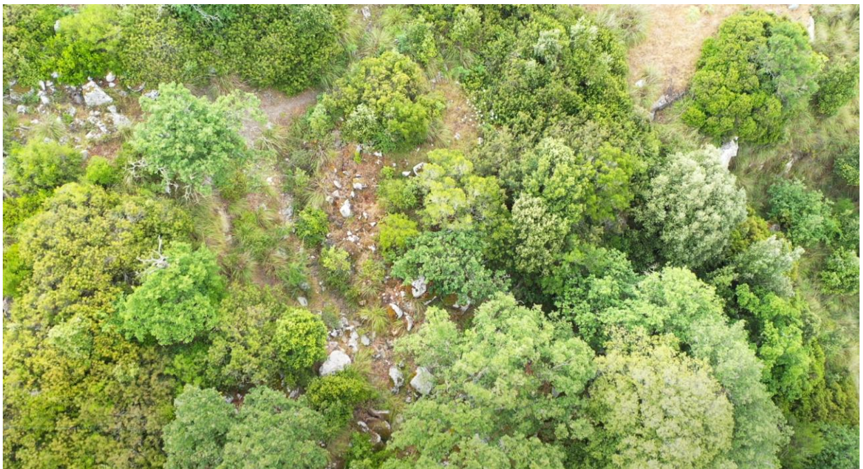
Vista dettagliata costone