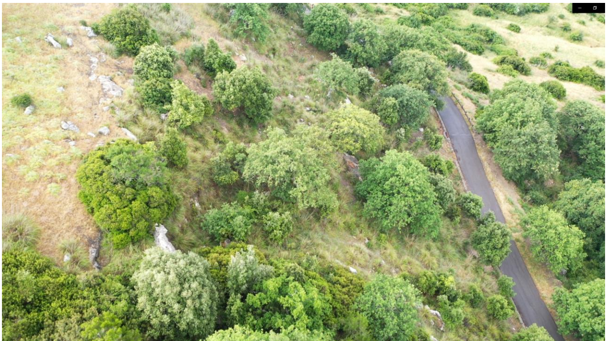
Vista limite superiore costone