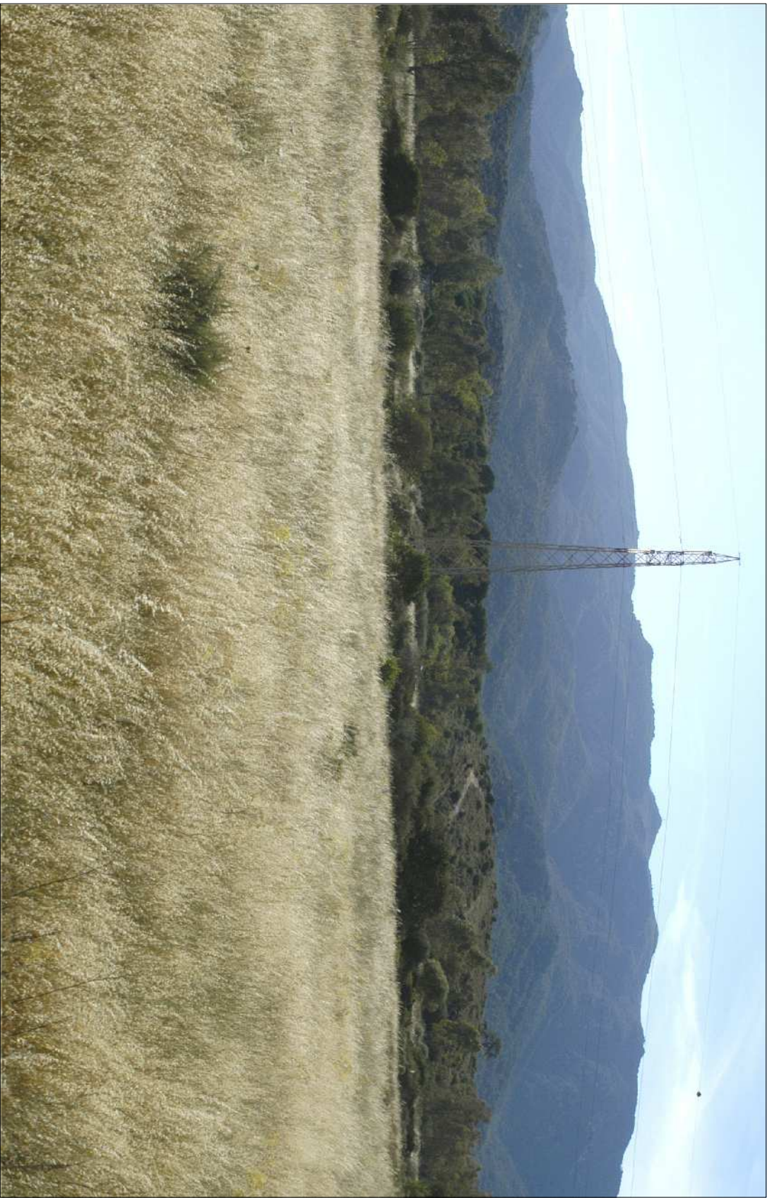
FOTO 8: Stato attuale dell'area che ospiterà la buca 11 del nuovo percorso da golf "Gary Player"