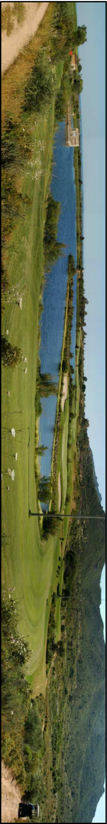
Foto 1 : vista verso est dell'area oggetto degli interventi di manutenzione del Percorso "Giallo" per la trasformazione in Percorso "Executive". Al centro il lago 48 che caratterizza il percorso