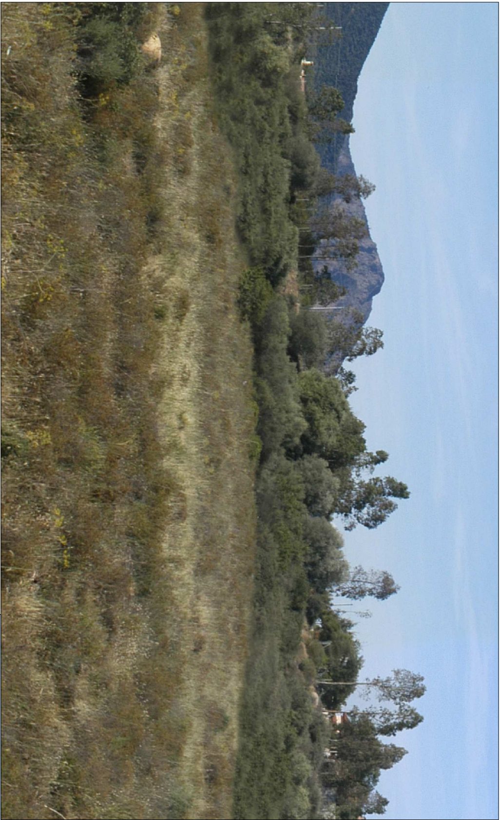
FOTO 4: Stato attuale dell'area che ospiterà la buca 5 - vista da sud