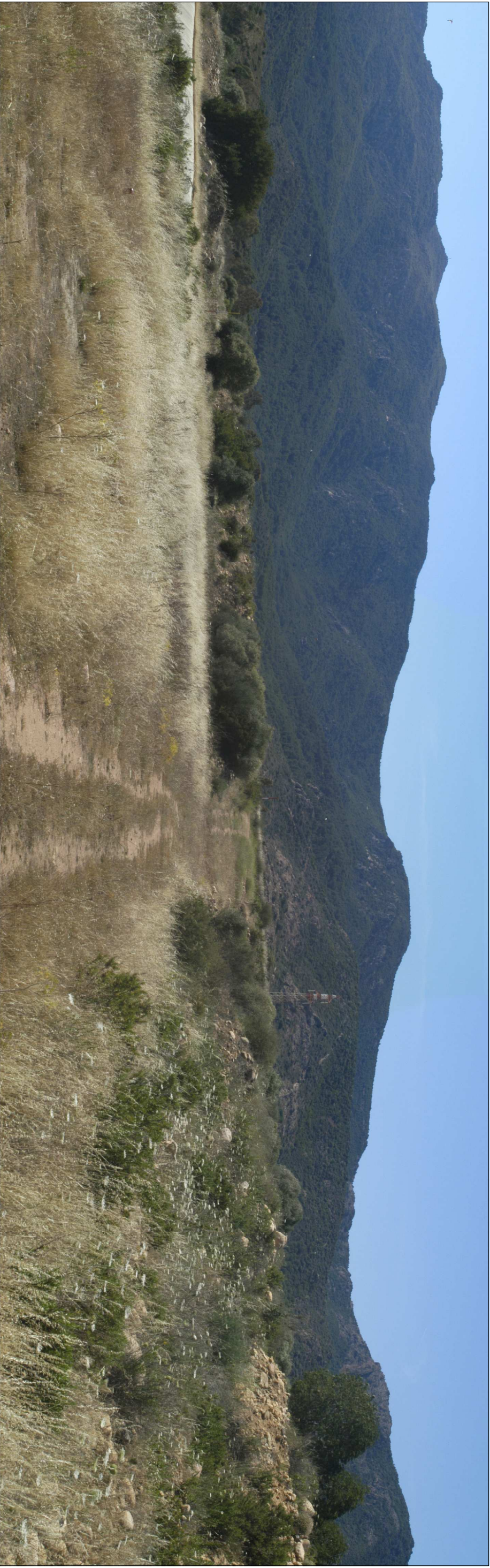
FOTO 3: Stato attuale dell'area che ospiterà la buca 4 del nuovo percorso da golf "Gary Player"