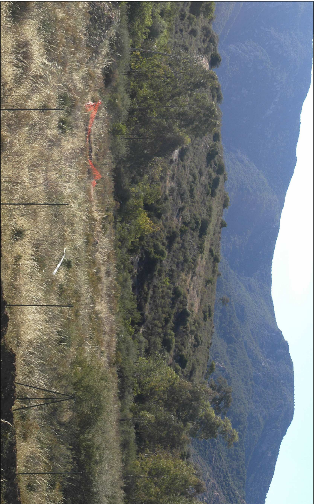
FOTO 9: Stato attuale dell'area che ospiterà la buca 12 del nuovo percorso da golf "Gary Player"