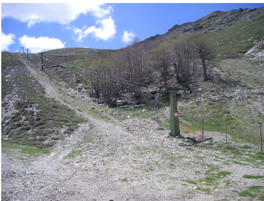
Fig n. 1: Situazione attuale - Skilift

Lo ski-lift esistente è caratterizzato da una portata oraria di 720 persone e si sviluppa su un tracciato di 926 metri, raggiungendo la quota di 1.825 metri. I pali di sostegno hanno un'altezza di circa 6 m.