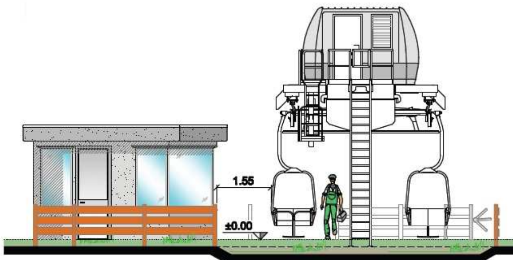
Fig n. 2 - Stralcio Particolari costruttivi stazione di partenza - Prospetto frontale

La cabina di comando è posizionata a fianco alla pedana di imbarco per permettere al macchinista di controllare il movimento dei viaggiatori, il funzionamento dell'impianto ed il tratto iniziale della linea. È destinata inoltre ad accogliere le apparecchiature di comando e controllo dell'impianto e l'azionamento elettrico.