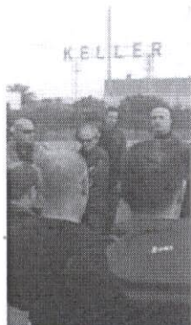
Gli ex operai della Keller

► È in vendita all'asta lo stabilimento Keller di Villaciuro. Così come stabilito dal tribunale di Cagliari che più di un anno fa ne dichiarò il fallimento sarà venduto tramite gara il ramo d'azienda costituito dal complesso di fabbricati nella località Cannamada, beni mobili registrati, macchinari per la produzione, mobili e macchine d'ufficio, giacenze magazzino, brevetti. Tutto ciò sarà offerto al miglior acquirente, assieme ad un pezzo