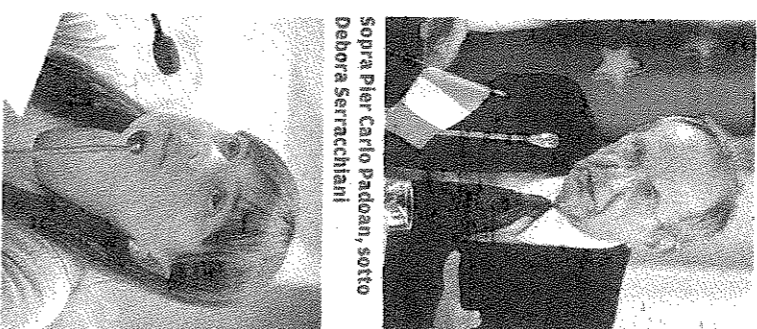
Sopra Pier Carlo Padoan, sotto Debora Serracchiani