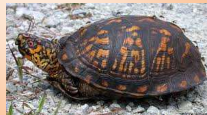
TESTUDO TERRAPENE CAROLINA