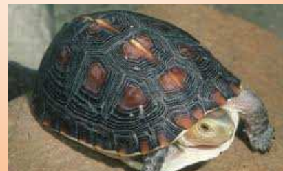
TESTUDO CUORA FLAVOMARGINATA