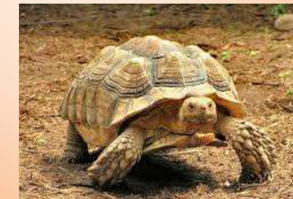
TESTUDO GEOCHELONE SULCATA