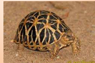
TESTUDO GEOCHELONE RADIATA