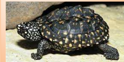
TESTUDO GEOCLEMYS HAMILTONII