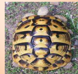
TESTUDO HERMANNI BOETGERI