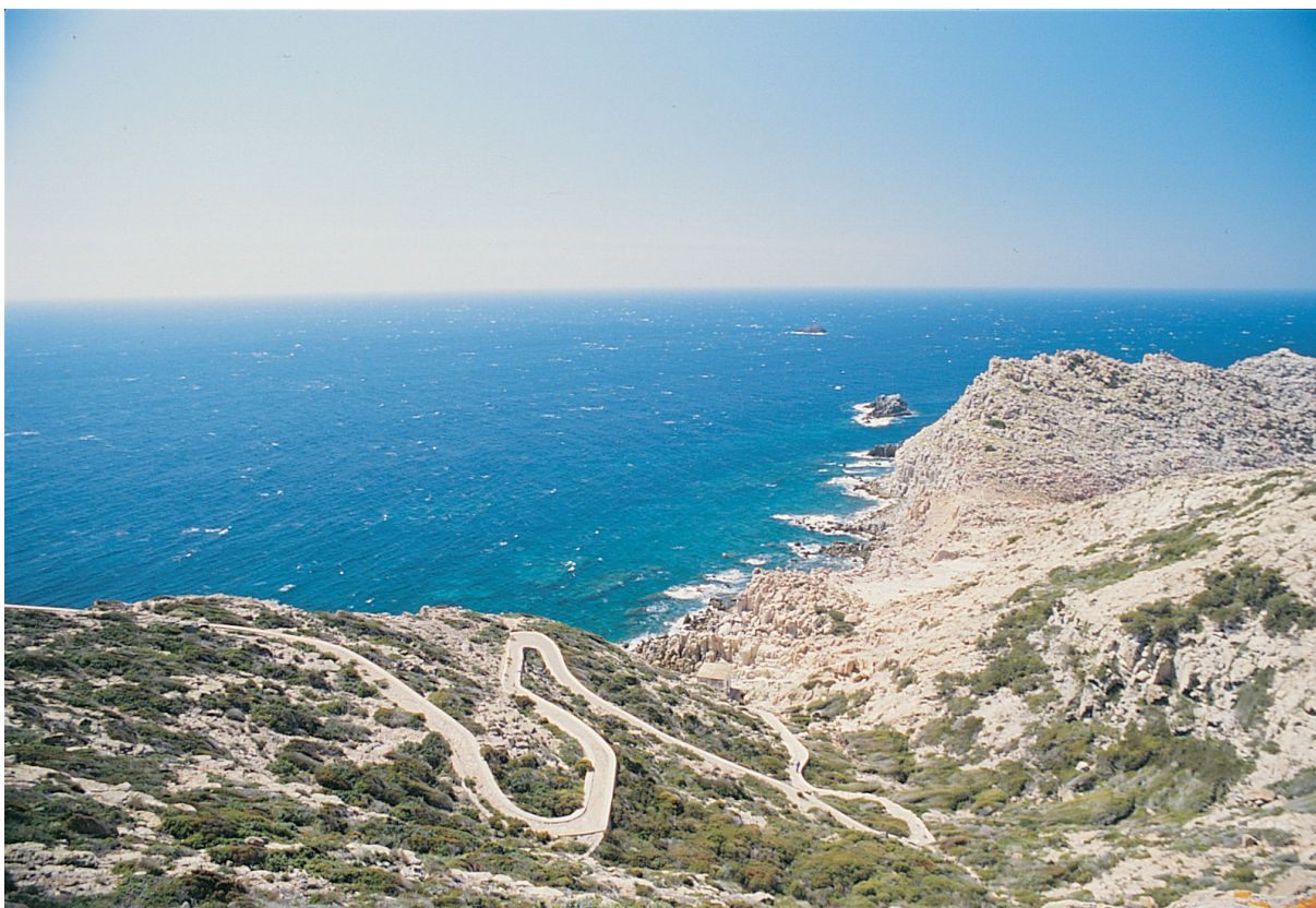
Fig. 35 - Panorami costieri dell'Isola di San Pietro

relazioni sociali, culturali e simboliche, al cui interno il singolo bene è inserito.