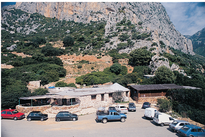
Fig. 39 - Quasi al piede della Perda Longa, un parcheggio e strutture per il visitatore.

carattere originario di un antico luogo di culto agreste, dove in occasione delle feste si sostava all'ombra degli olivastri monumentali. In questo punto tuttavia la trasformazione antropica, se da un lato banalizza il sito, dall'altro assicura migliore protezione agli alberi.