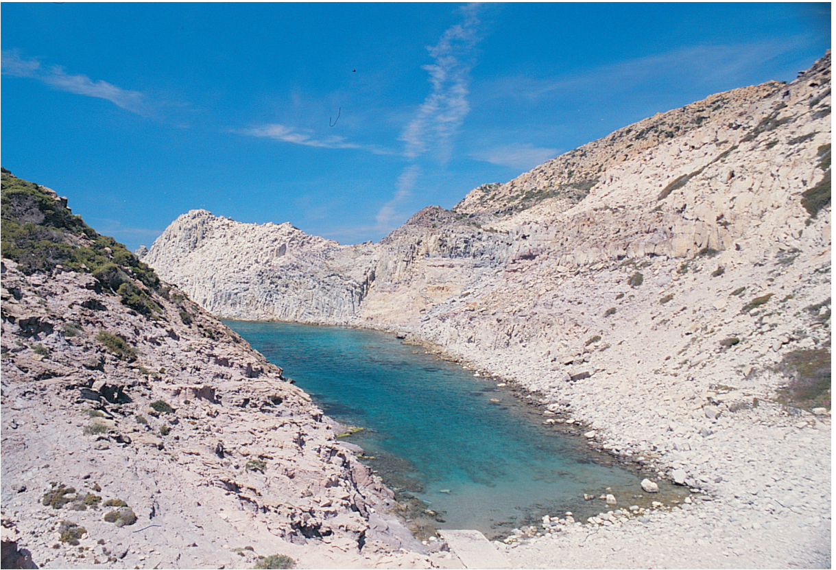
Fig. 36 - Ria di Cala Fico, Isola di San Pietro

Gli obiettivi sui quali possono convergere gli sforzi di collaboratori con diverse competenze sono essenzialmente l'indicazione di itinerari turistici e la produzione di materiale informativo (pannelli tematici, guide a stampa, cartografia, diorami). Punto d'incontro tra l'area naturalistica e i beni culturali presenti sul territorio sono l'osservazione e la presentazione al pubblico di connessioni relative ai seguenti punti: