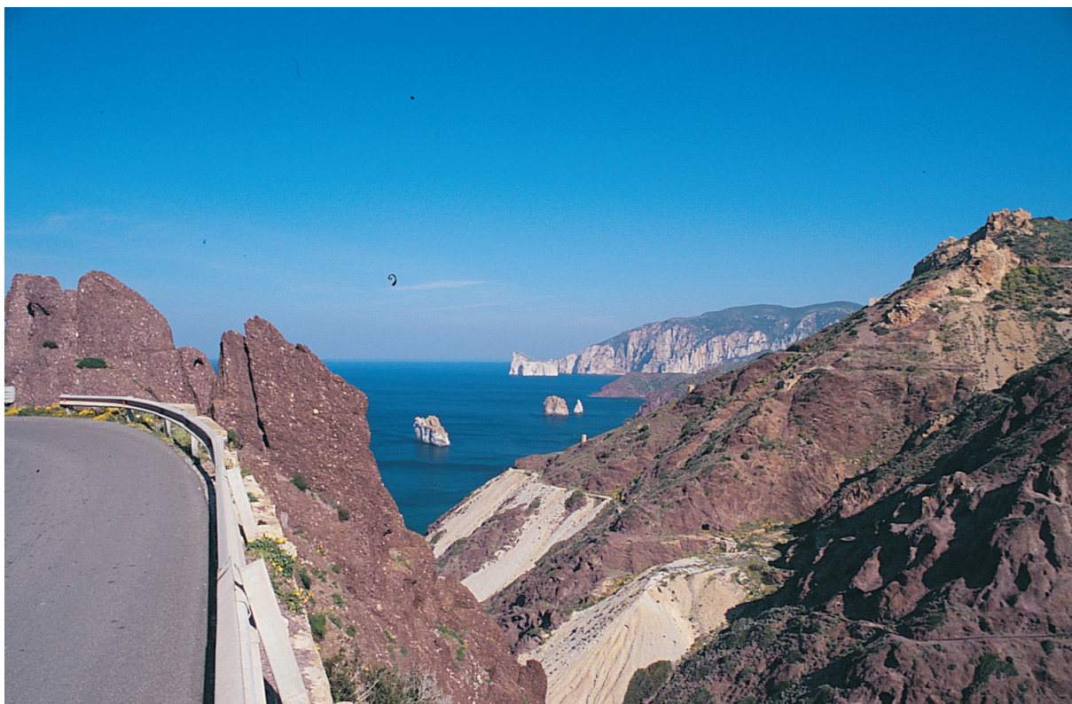
Fig. 40 - La costa tra Masua e Nèbida.