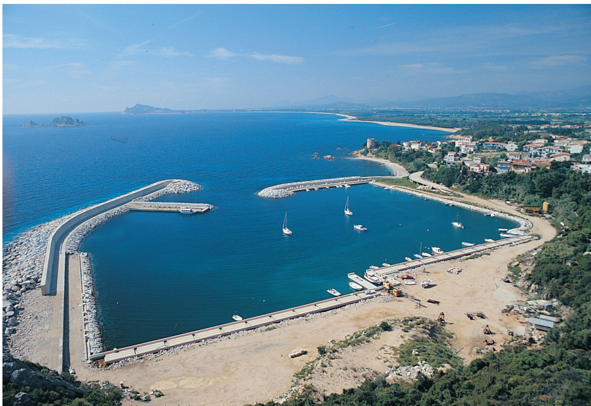
Fig. 37 - Il porto turistico a S. Maria Navarrese, in comune di Baunei

caratterizza l'altopiano sul quale sorge Perda 'e Liana, dove il pascolo è stato esercitato sino ad un anno fa su terreni gravati da uso civico. Il legnatico è stato arrestato solo da un triennio, a seguito della concessione all'Ispettorato foreste della Provincia di Nuoro di una superficie di circa 3.000 ha per forestazione. Eliminate le due principali forme di prelievo, si avrà una ripresa dell'ecosistema.