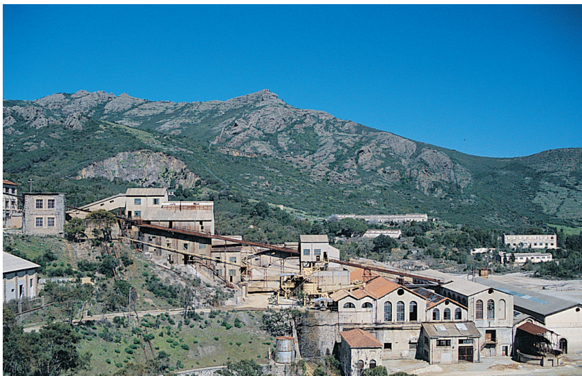
Fig. 38 - La miniera di Montevecchio, in comune di Gùspini, è al centro di un importante progetto di archeologia industriale