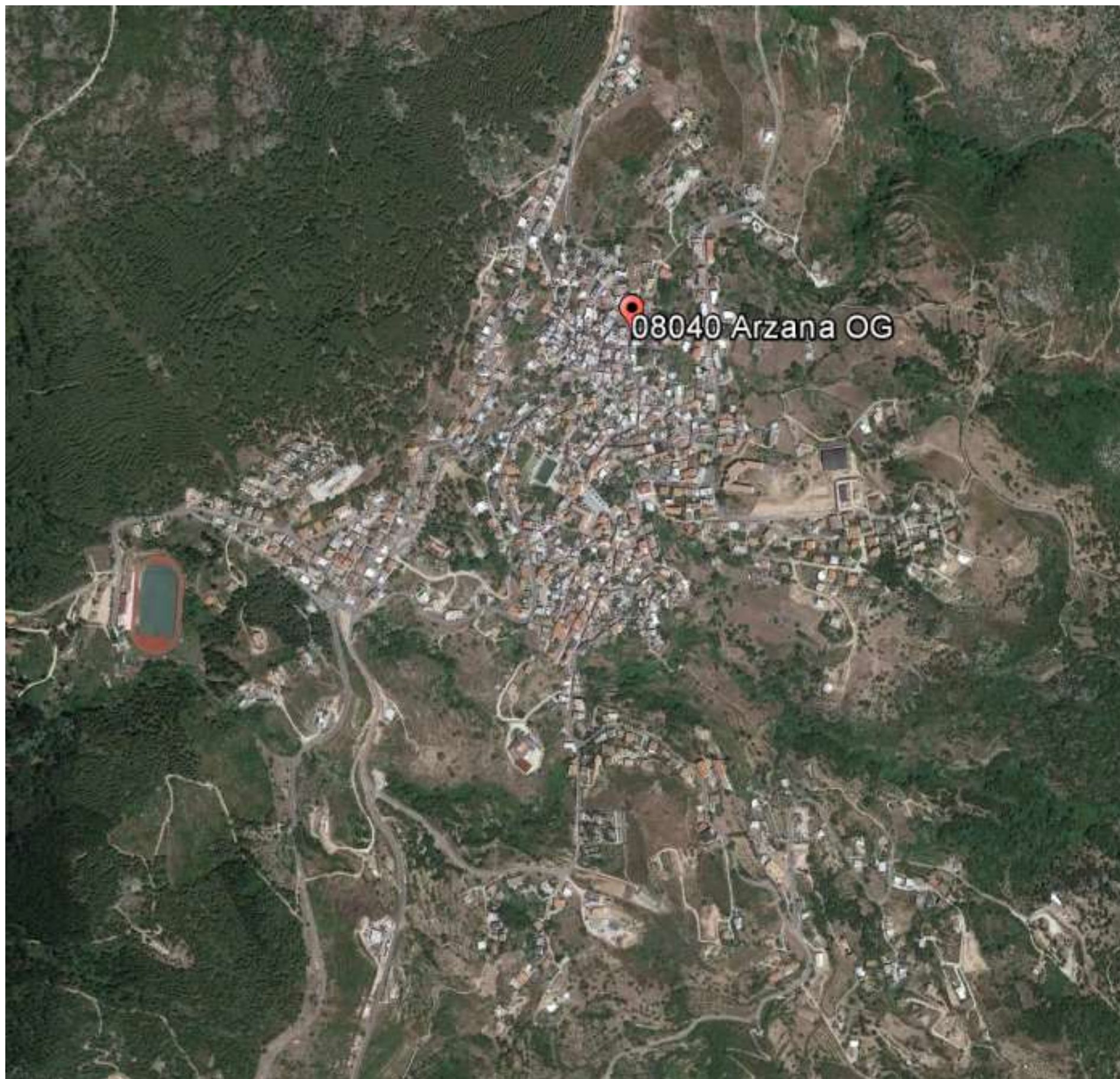
ORTOFOTO CENTRO ABITATO ARZANA