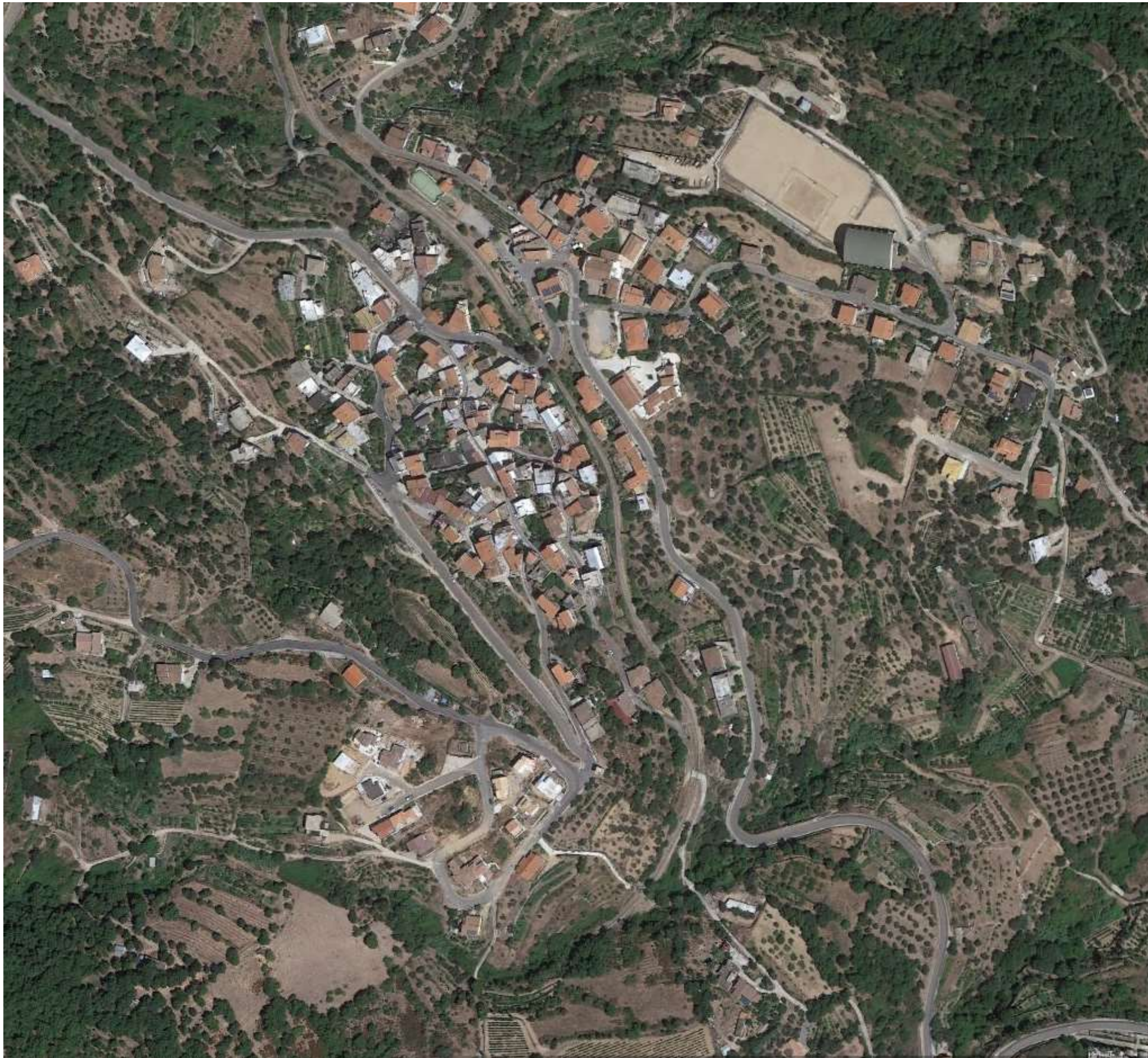
ORTOFOTO CENTRO ABITATO ELINI