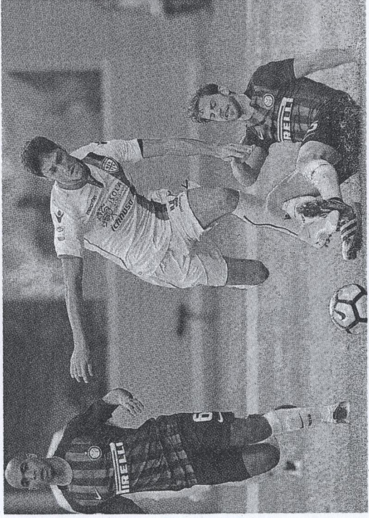
Vigilia difficile per i giocatori del Cagliari che domani affrontano in casa il Sassuolo

Ritiro infinito. Nel colloquio con il patron - silenzioso in questi giorni - Rastelli sa di essere tra i primi imputati: dalle goleade alle reazioni opa-