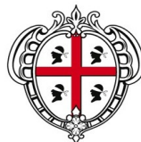
Tabella E - Allegata alla determinazione d'impegno rep. n. 2262 del 28.12.2011 Capitolo SC03.0137 Causale: contributi per acquisto attrezzature per la conservazione