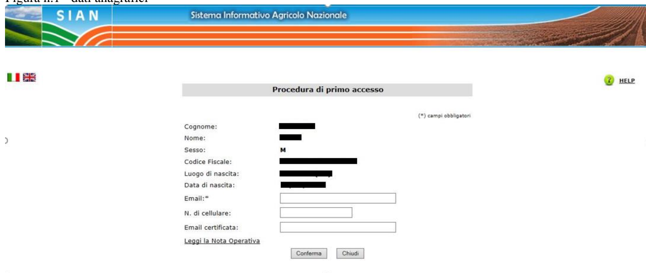
Figura n.1 - dati anagrafici

Vengono prospettati i dati anagrafici del soggetto. Per proseguire è obbligatorio indicare un indirizzo email personale.