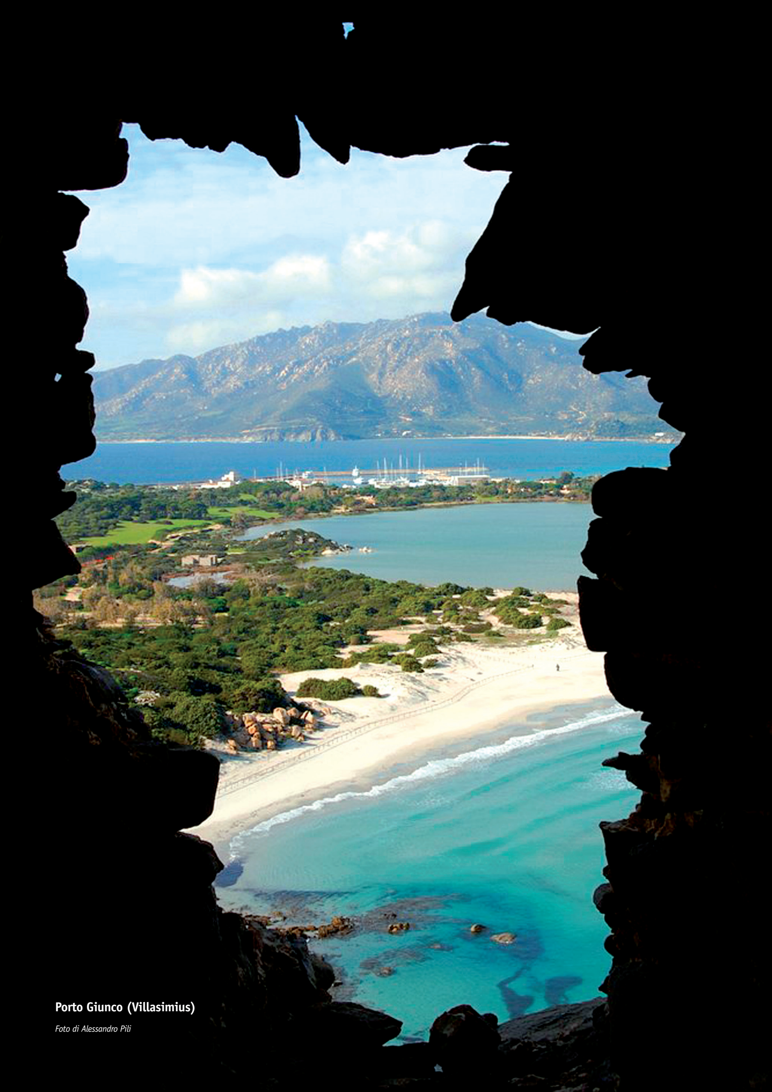
Porto Giunco (Villasimius)