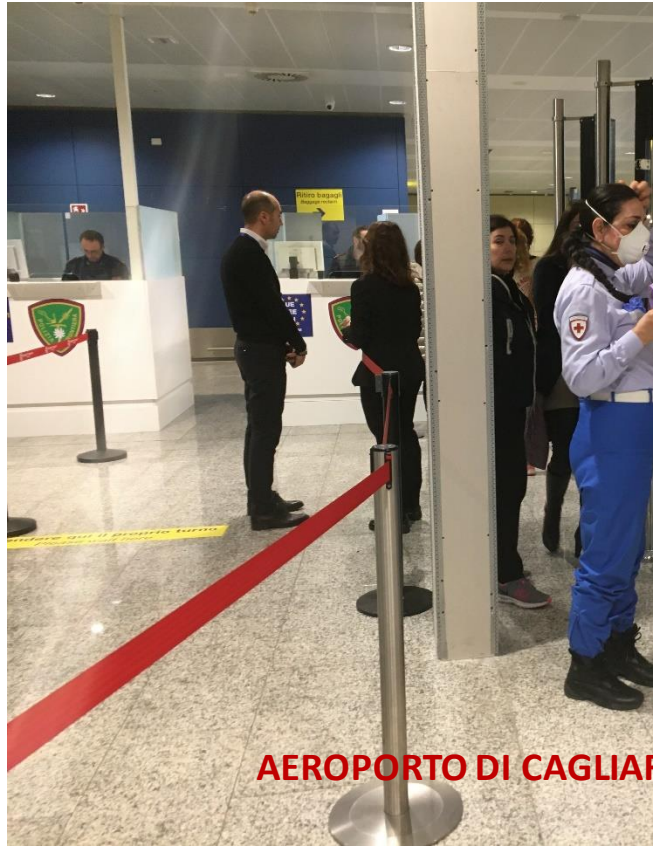
AEROPORTO DI CAGLIARI