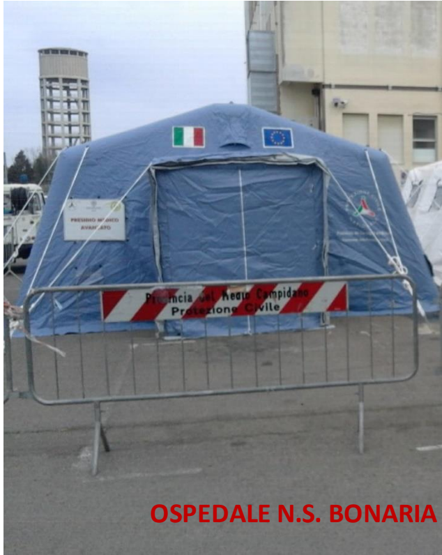
OSPEDALE N.S. BONARIA