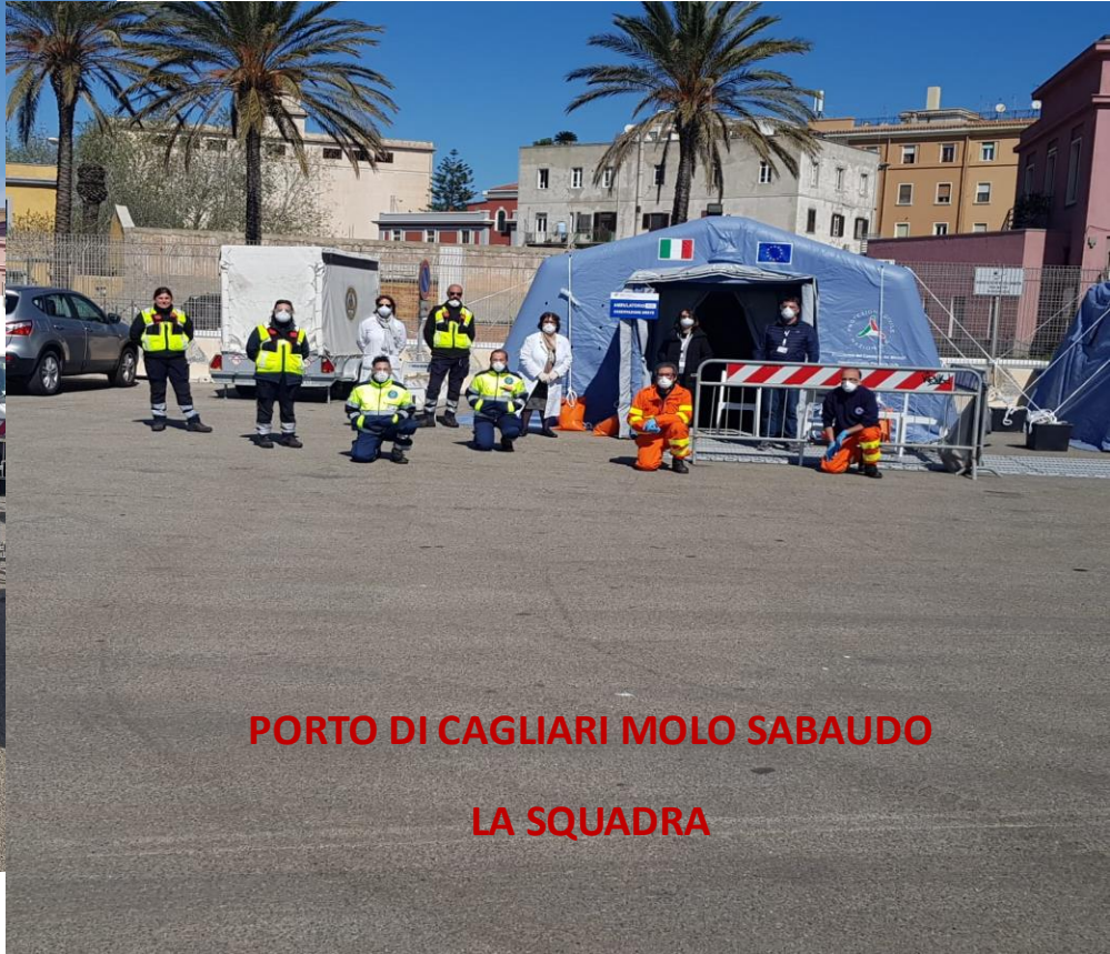
PORTO DI CAGLIARI MOLO SABAUDO LA SQUADRA