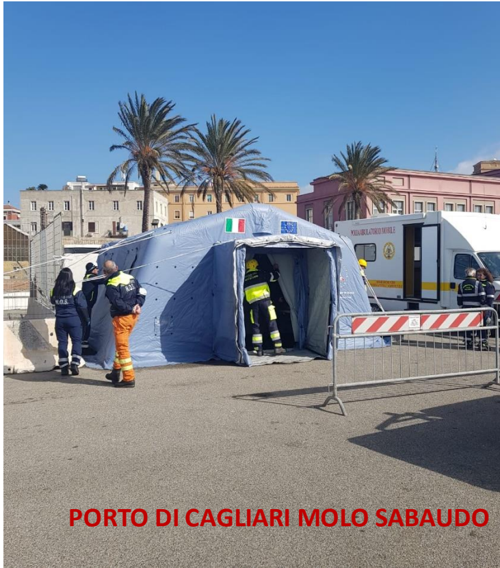
PORTO DI CAGLIARI MOLO SABAUDO