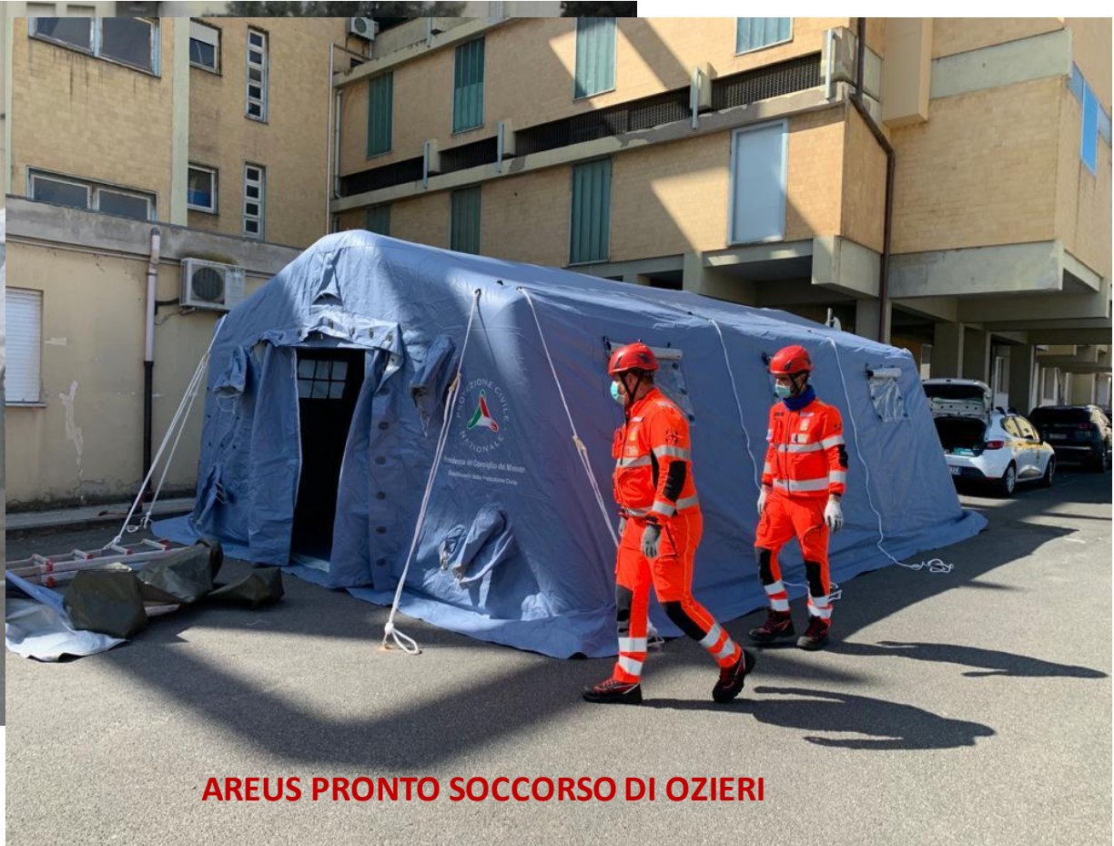
AREUS PRONTO SOCCORSO DI OZIERI