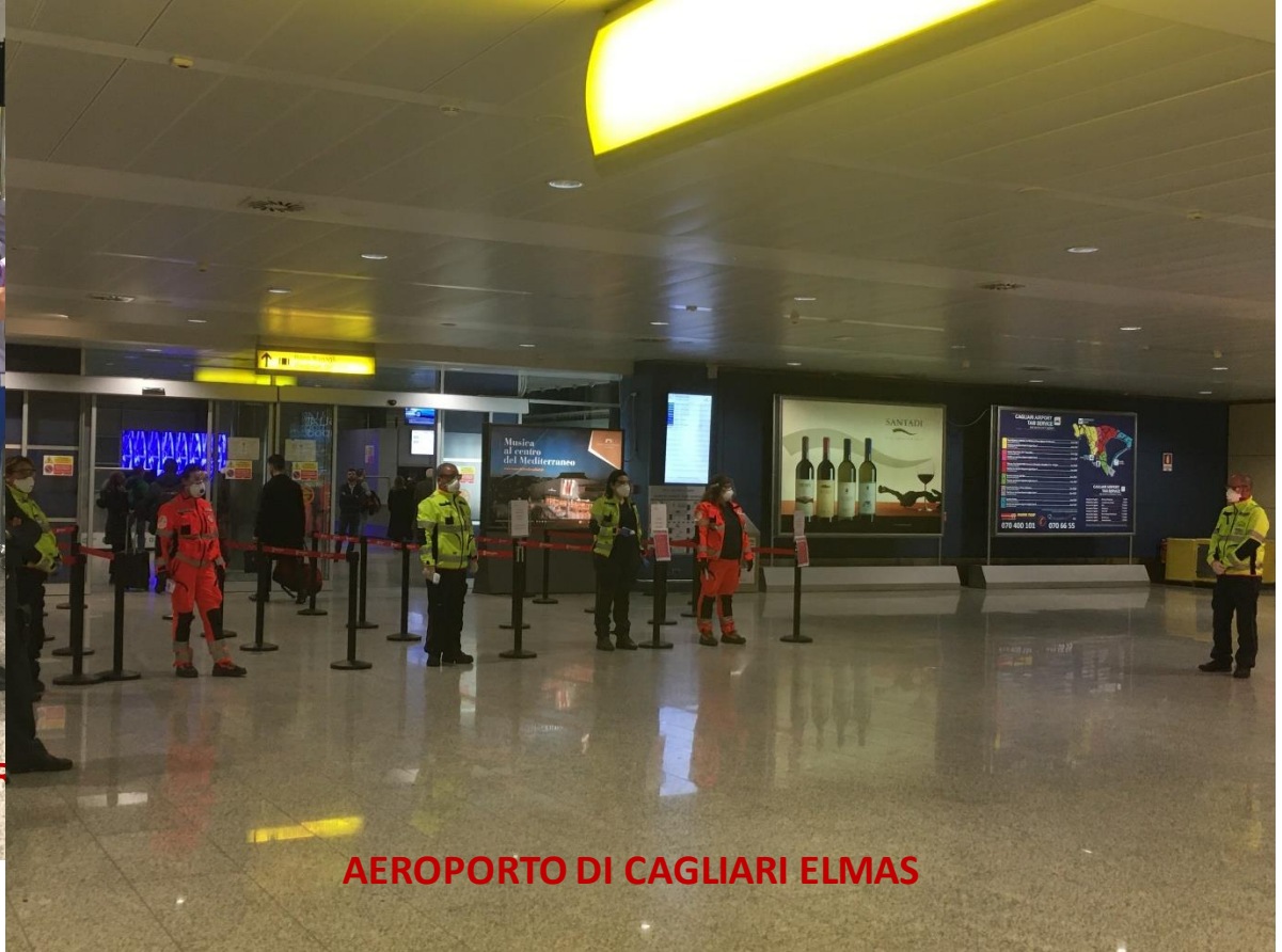
AEROPORTO DI CAGLIARI ELMAS